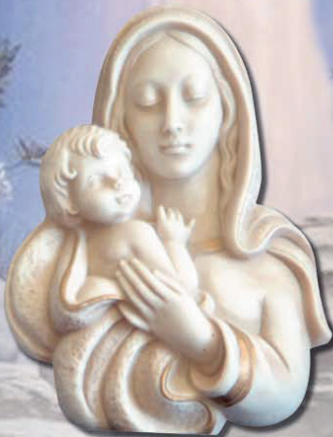
MADONNA CON BAMBINO ART 517 12x8