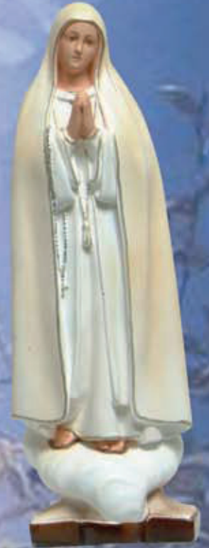
ART. 1238 - H cm 38