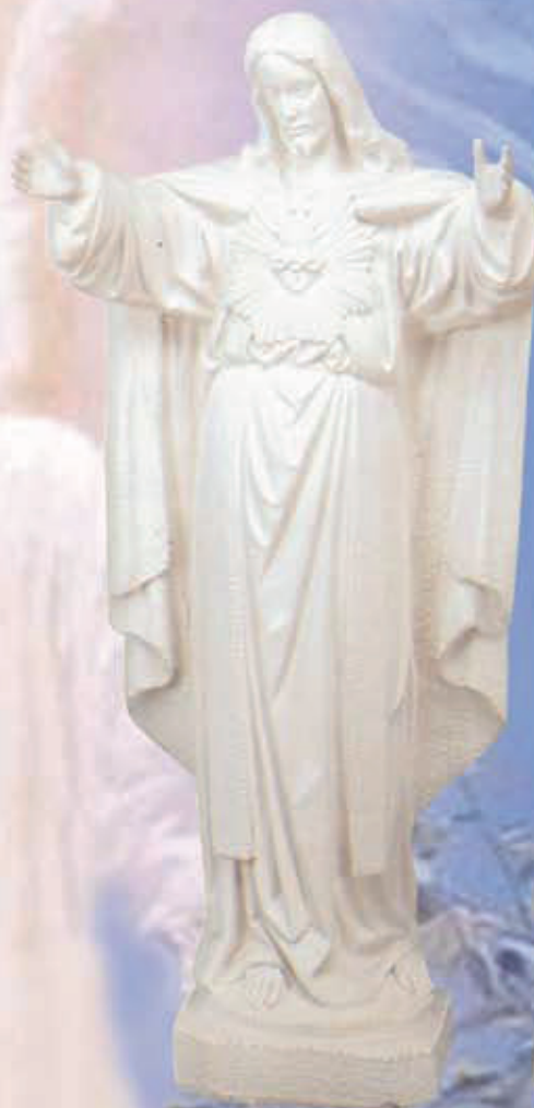
ART. 1301 - H cm 40/75