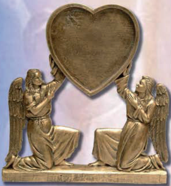
ART. 2237 - cm 45