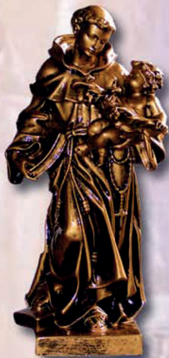
ART. 1291 - H cm 15/30/40