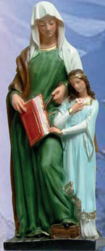
ART. 1236 - H cm 44