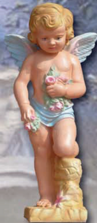
ART. 1255 - H cm 70