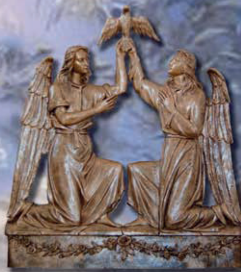
ART. 1216 - cm 120x120

ART 1216 TARGA ANGELI DELLO SPIRITO SANTO ART 2236 TARGA DELLA DEPOSIZIONE ART 2234 TARGA CRISTO DX - ART 2235 TARGA CRISTO SX ART 2237 TARGA ANGELI DEL CUORE