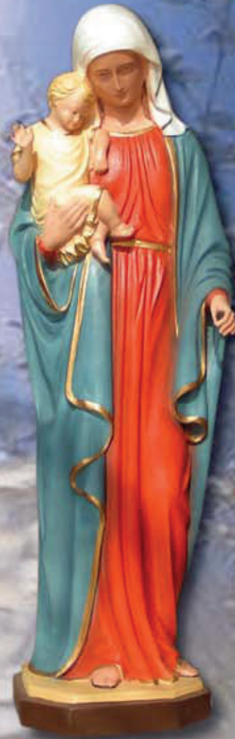
ART. 1261 - H cm 50

ART 1260 VERGINE STILIZZATA ART 1261 MADONNA CON BAMBINO