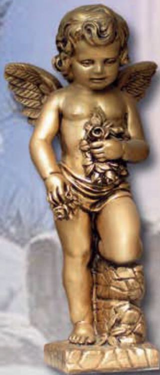
ART. 1255 - H cm 70