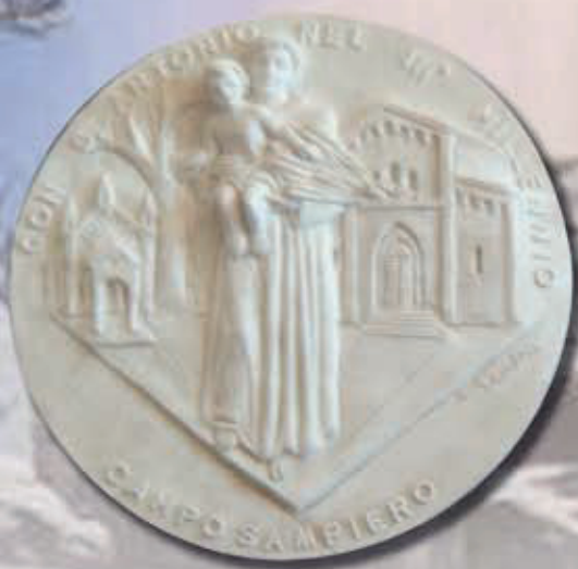
TARGA SANT'ANTONIO ART 1219 - Ø 28