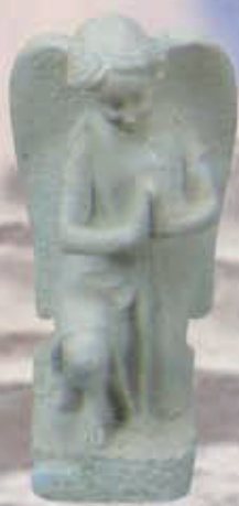
ART. 1306 - H cm 18,5