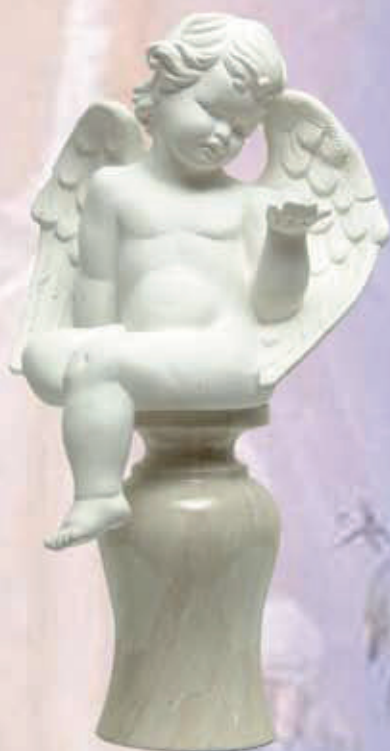
ART. 1303 - H cm 40