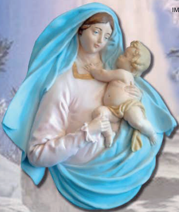
MADONNA COL BAMBINO ART 1219 cm 35x25