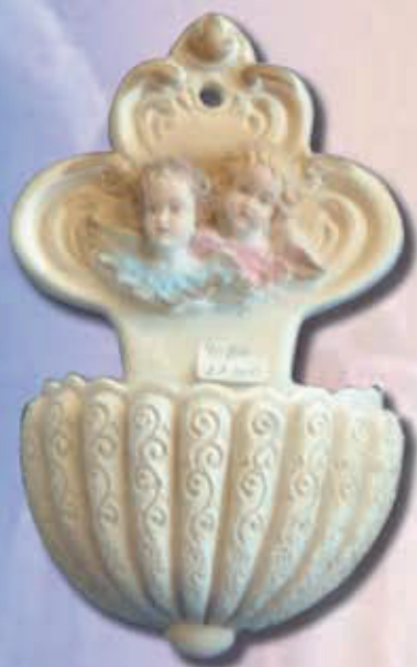
ART 2225 - cm 16