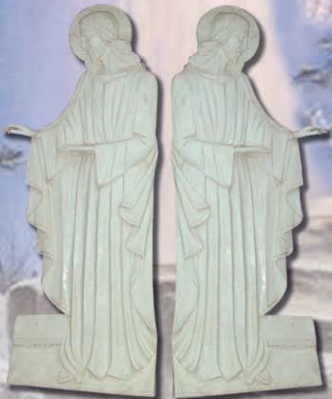
ART. 2234 - cm 180