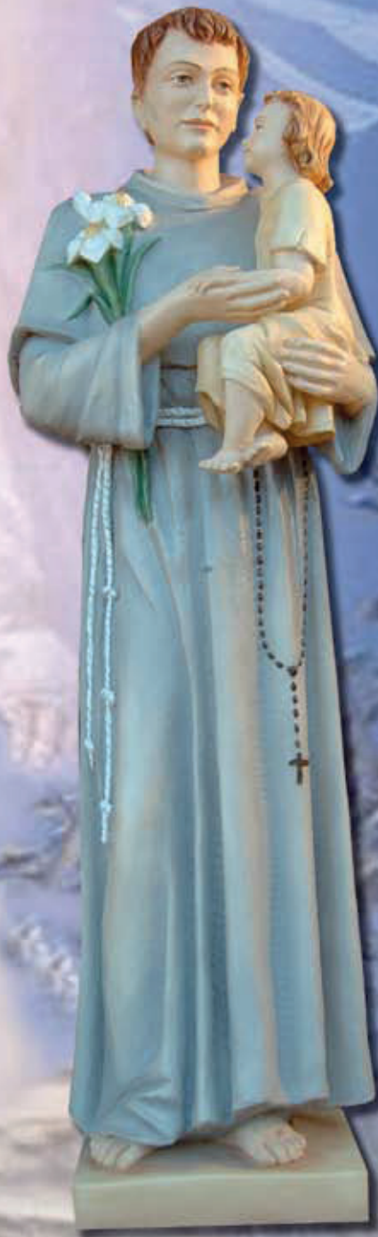
ART. 1210 - H cm 160

ART 1217 STATUA MADONNA IMMACOLATA ART 1210 STATUA SANT'ANTONIO DA PADOVA