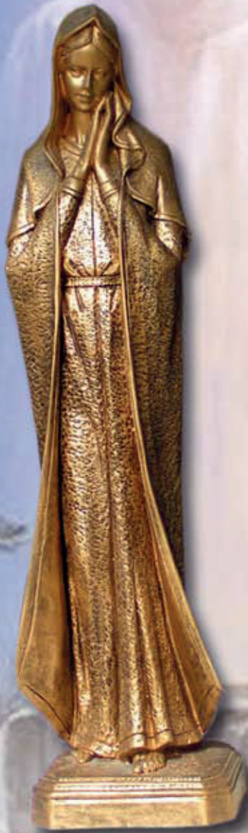
ART. 1260 - H cm 60