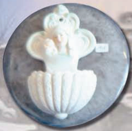
ART 2228 - Ø 18