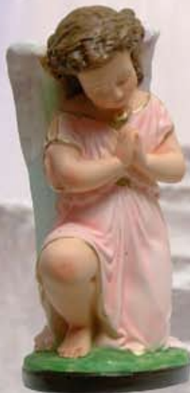
ART. 1226 - H cm 26