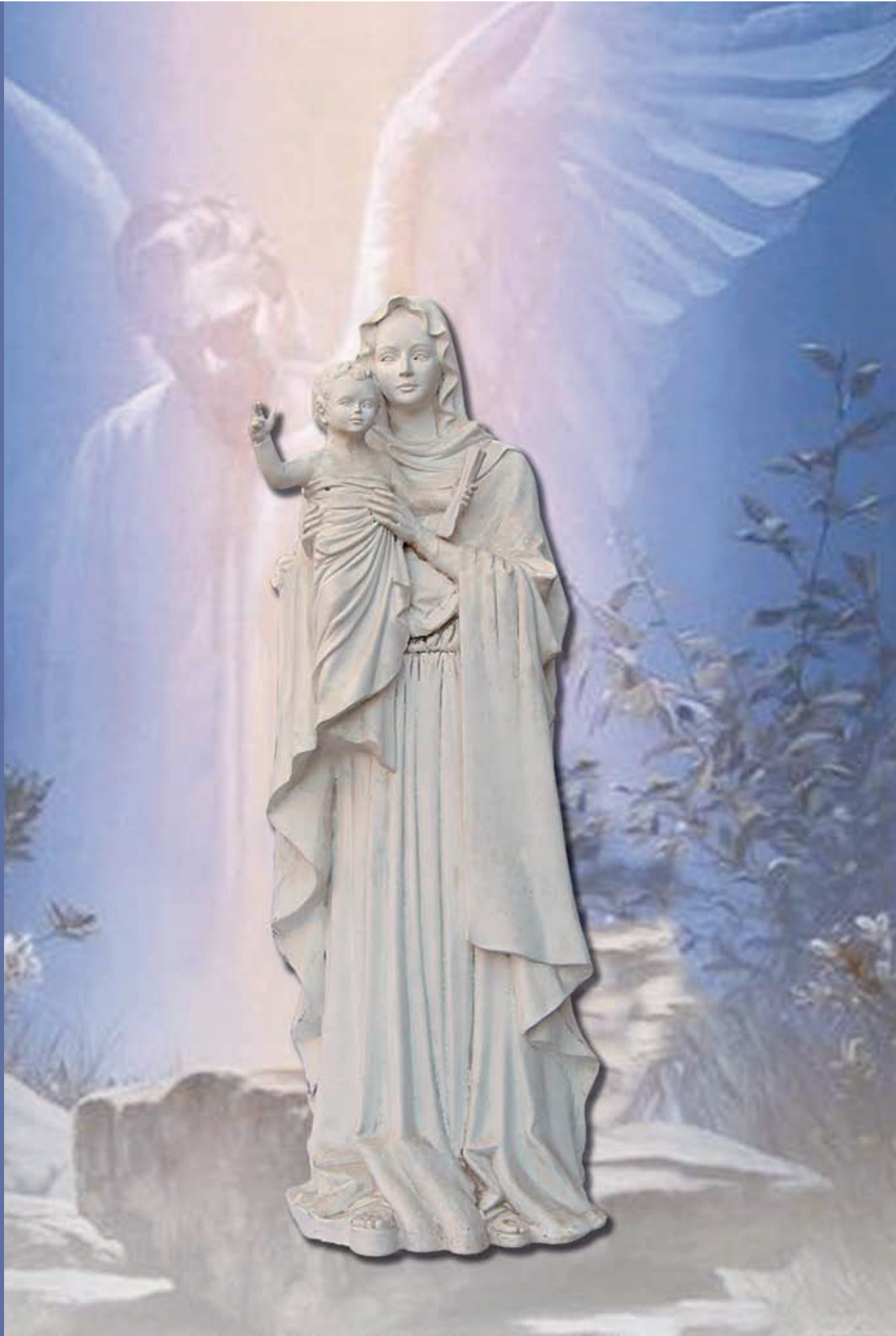
ART. 1309 MADONNA CON BAMBINO CM 120