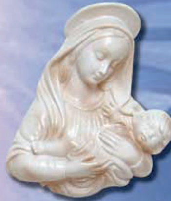
art 503 - cm 22