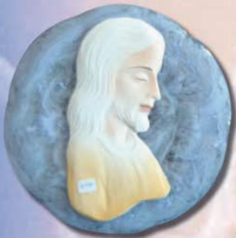
TARGA GESÙ SU PLACCA ART 2231 - Ø 25