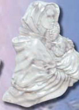
art 507 - cm 22