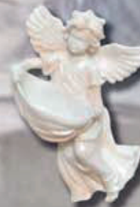
art 513 -cm 16