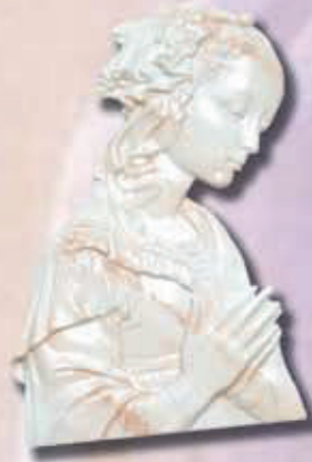
art 502 - cm 20