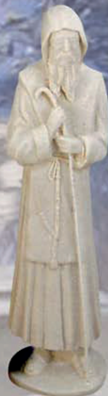
ART. 1296- H cm 35

ART 1250 SAN ROCCO ART 1246 SAN MATTEO ART 1249 SAN LORENZO