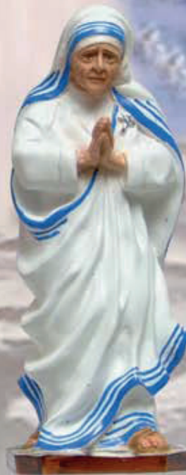
ART. 1241 - H cm 39