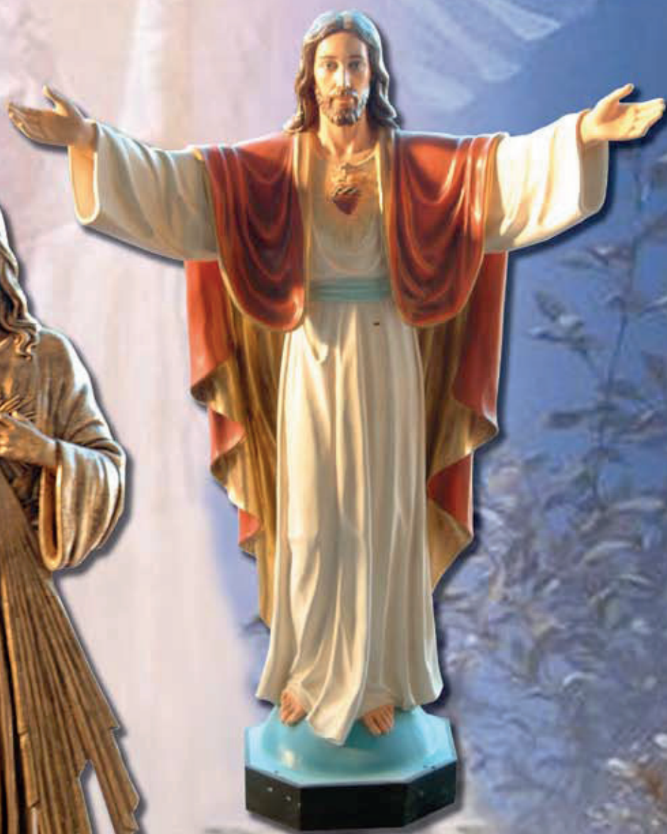
ART. 1201 - H cm 180