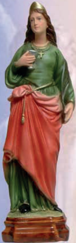
ART. 1237 - H cm 41