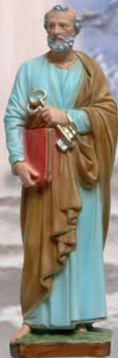
ART. 1247 - H cm 42