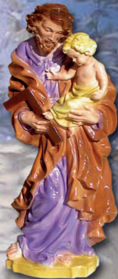
ART. 1294 - H cm 30/40