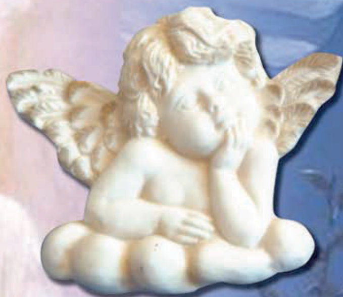
IMMAGINE PUTTO ART 516 cm 8x8