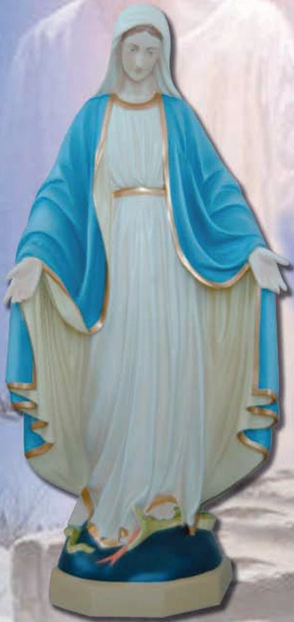
ART. 1217 - H cm 125