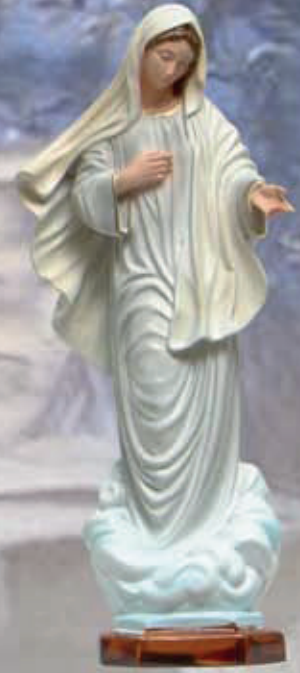
ART. 1233 - H cm 32/42/60

ART 1231 MADONNA ADDOLORATA ART 1242 MADONNA DEL CARMELO ART 1238 MADONNA DI FATIMA