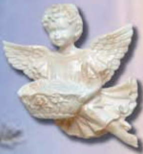
art 509 Sx cm 16x15x1,5