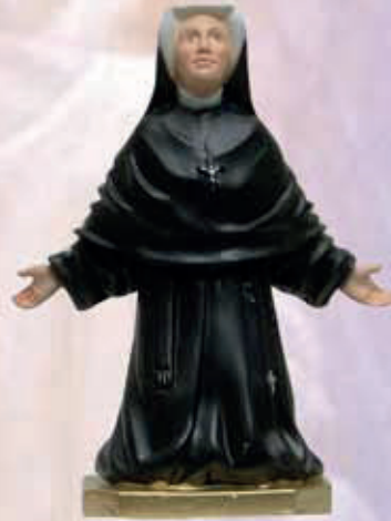
ART. 1227 - H cm 23