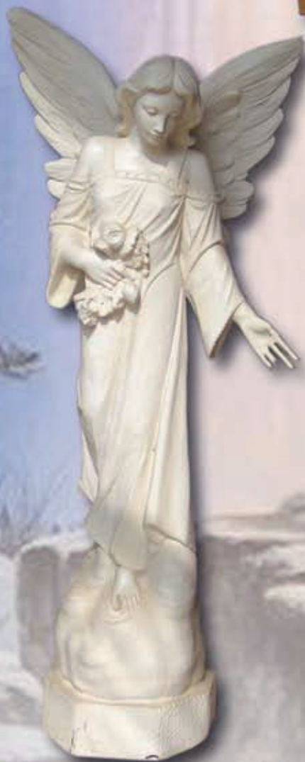
ART. 1257 - H cm 36