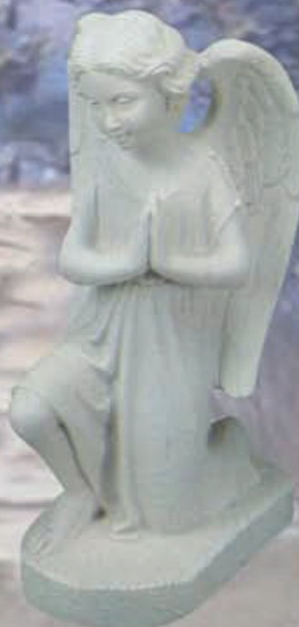
ART. 1307 - H cm 35