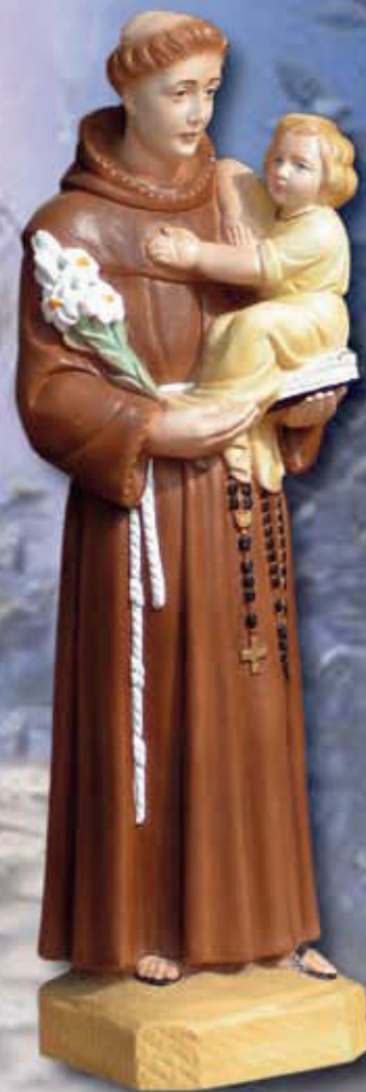
ART. 1291 - H cm 55