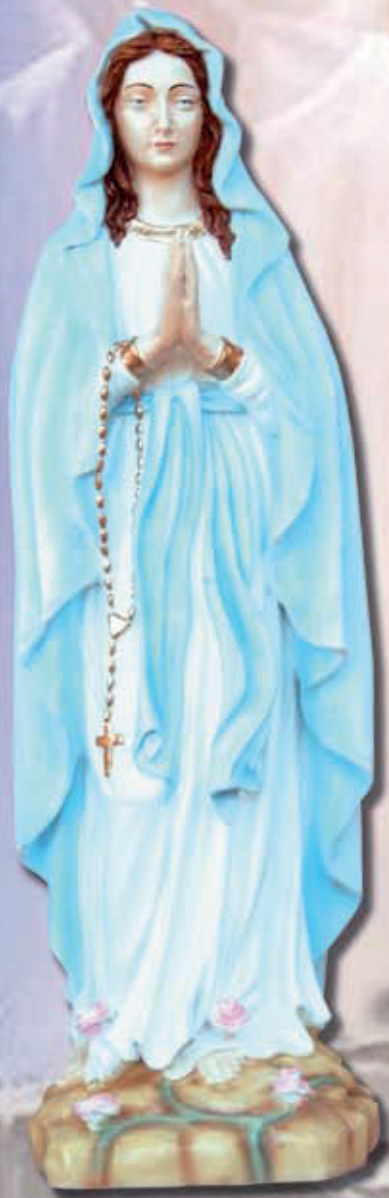
ART. 1205 - H cm 123