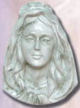
art 505 - cm 18