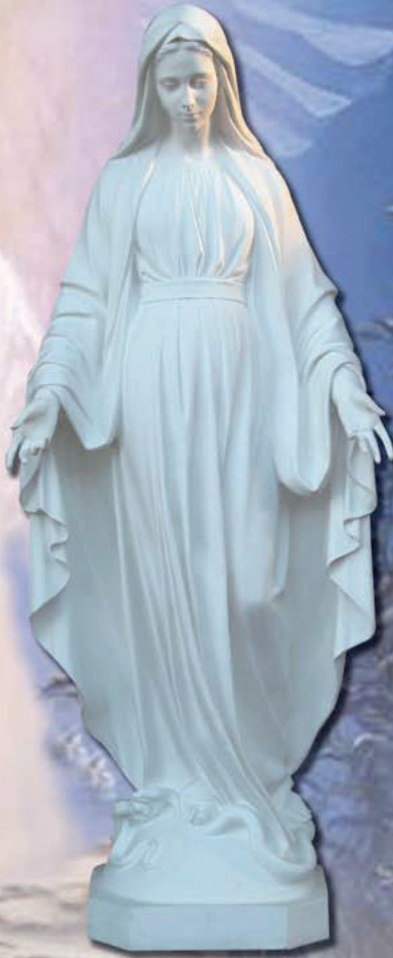
ART. 1208 - H cm 175

ART 1205 STATUA MADONNA DI LOURDES ART 1208 STATUA MADONNA IMMACOLATA