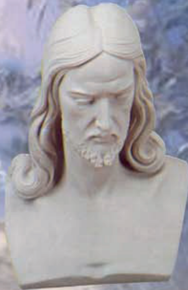
ART. 1308- cm 33

ART. 1287 ULTIMA CENA ART. 1288 CRISTO RISORTO ART. 3201 BUSTO CRISTO