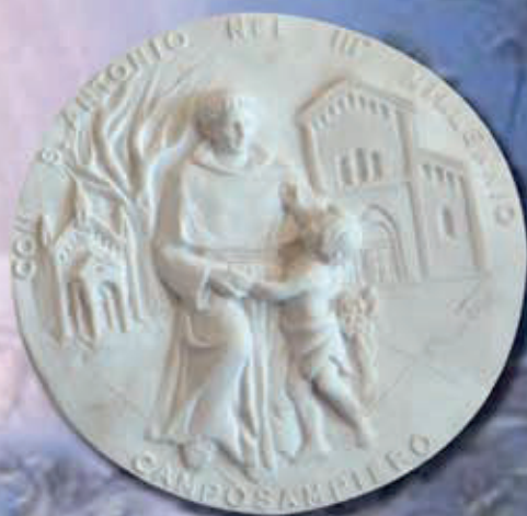
TARGA SANT'ANTONIO ART 1222 - Ø 28