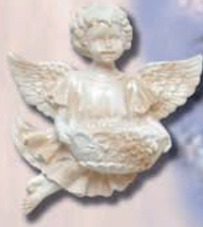
art 508 Dx cm 16x15x1,5