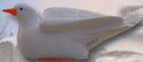
ART 4007 - cm 6x6x14