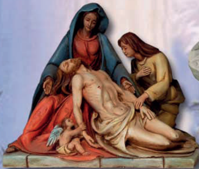
ART. 1263 - H cm 30