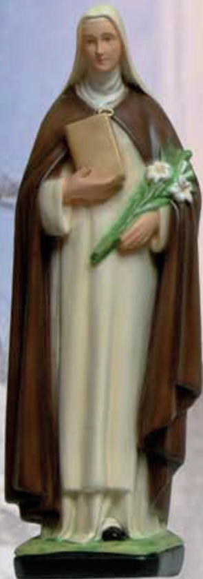
ART. 1232 - H cm 43