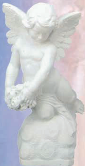
ART. 1302 - H cm 54