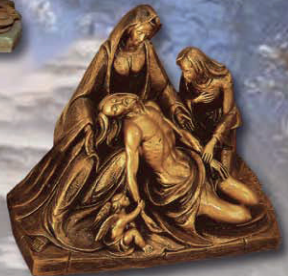
ART. 1263 - H cm 30