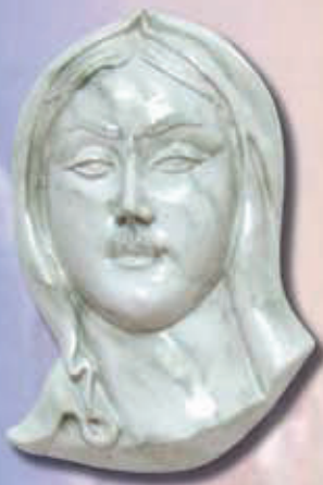
art 501 - cm 24