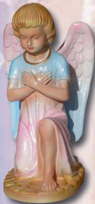
ART. 1252 - H cm 25