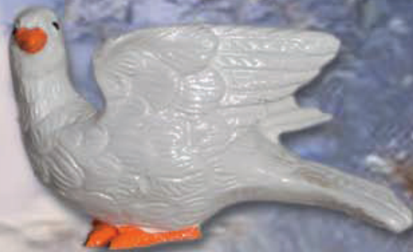
ART 4002 - cm 8x6x13