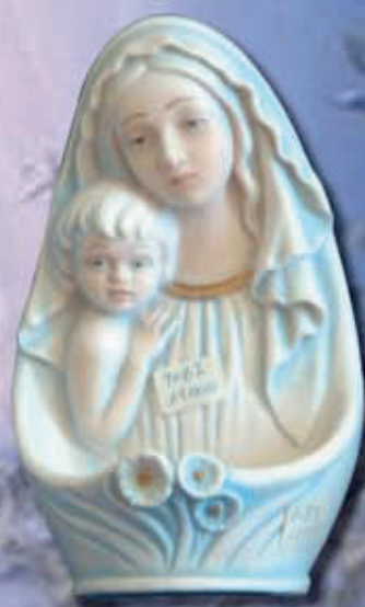
ART 2226 - cm 16