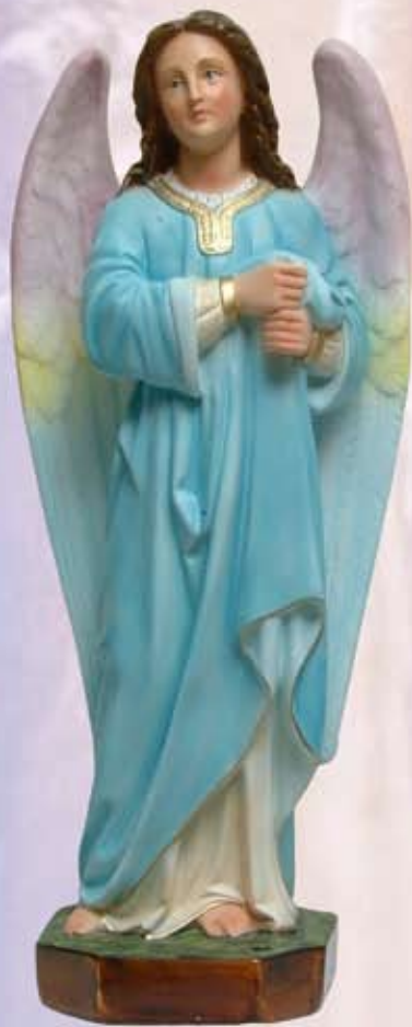
ART. 1229 - H cm 67