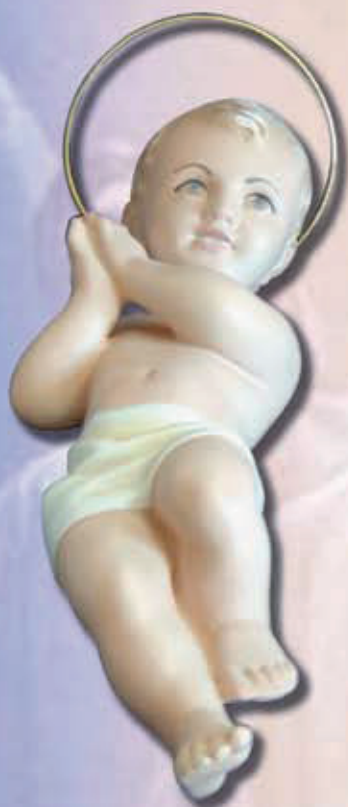
BAMBIN GESÙ ART 1211 cm 25