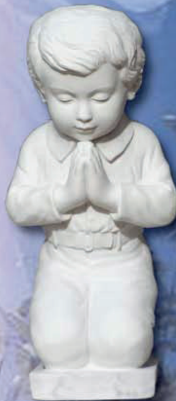
ART. 1258 - H cm 35