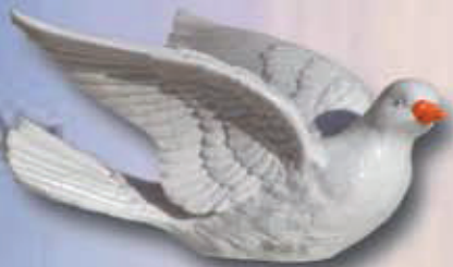
ART 4005 - cm 12x5x8