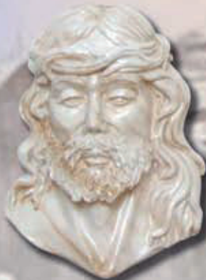
art 512 cm 21x12x6