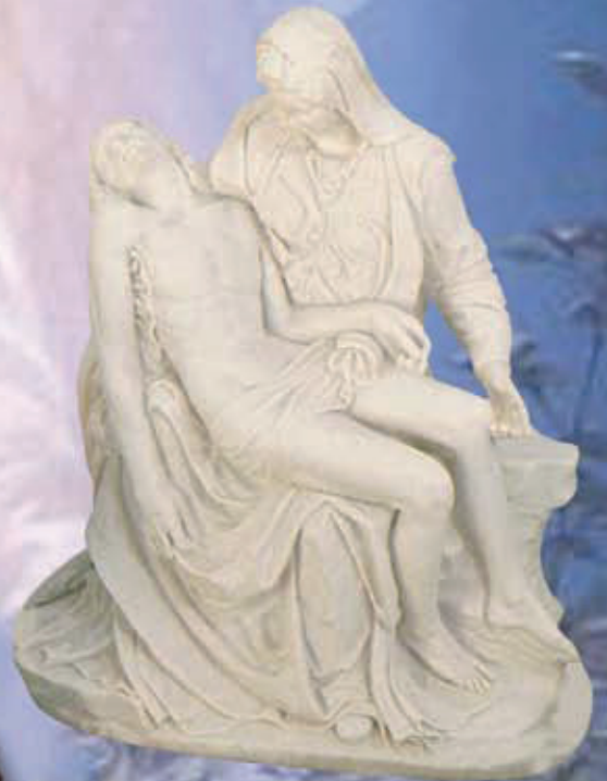
ART. 1262 - H cm 44