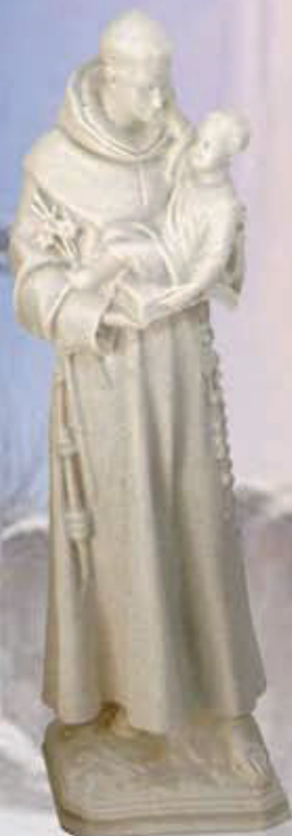
ART. 1297 - H cm 39