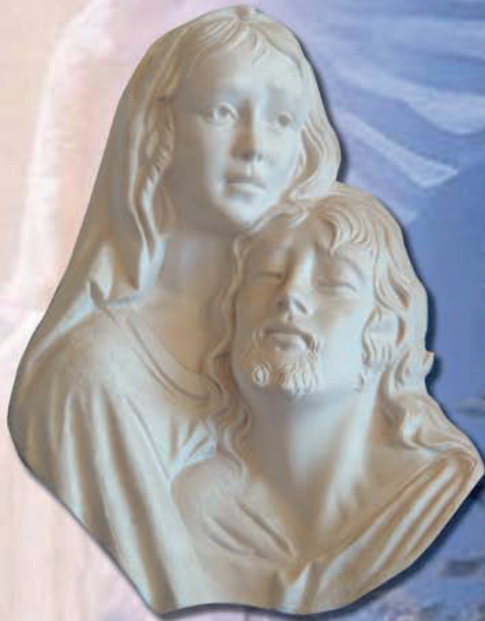
IMMAGINE MADONNA CON GESÙ ART 518