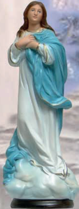
ART. 1235 - H cm 42