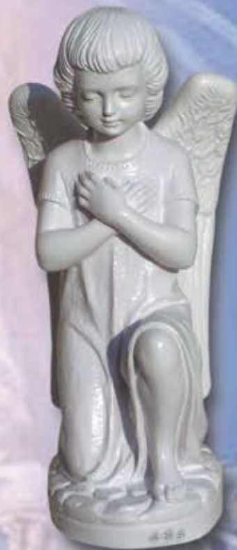
ART. 1253 - H cm 35