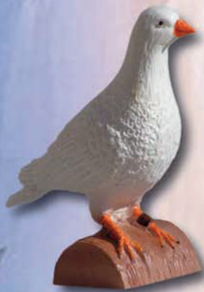
ART 4004 - cm 5x14