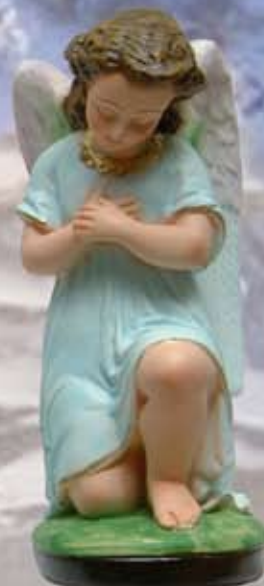
ART. 1225 - H cm 26

ART. 1229 ANGELO PORTACANDELE SX ART. 1230 ANGELO PORTACANDELE DX