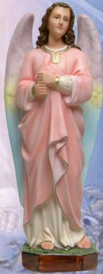
ART. 1230 - H cm 67