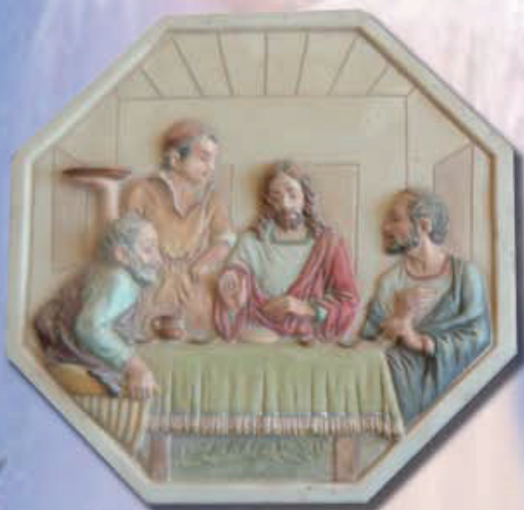
TARGA CENA EMMAUS ART 1221 - cm 33x33