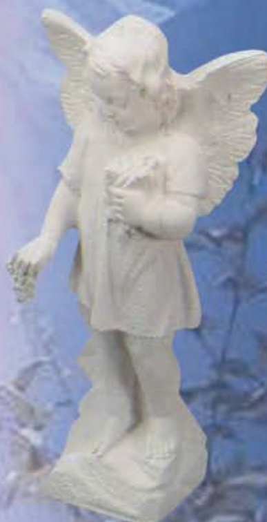
ART. 1304- H cm 34