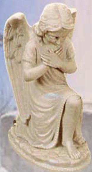
ART. 1305 - H cm 25