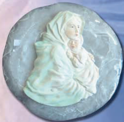
TARGA MADONNA SU PLACCA ART 2232 - Ø 25