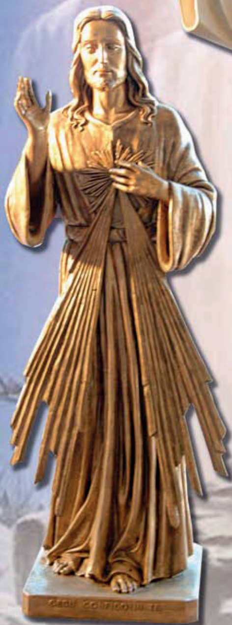
ART. 1202 - H cm 190