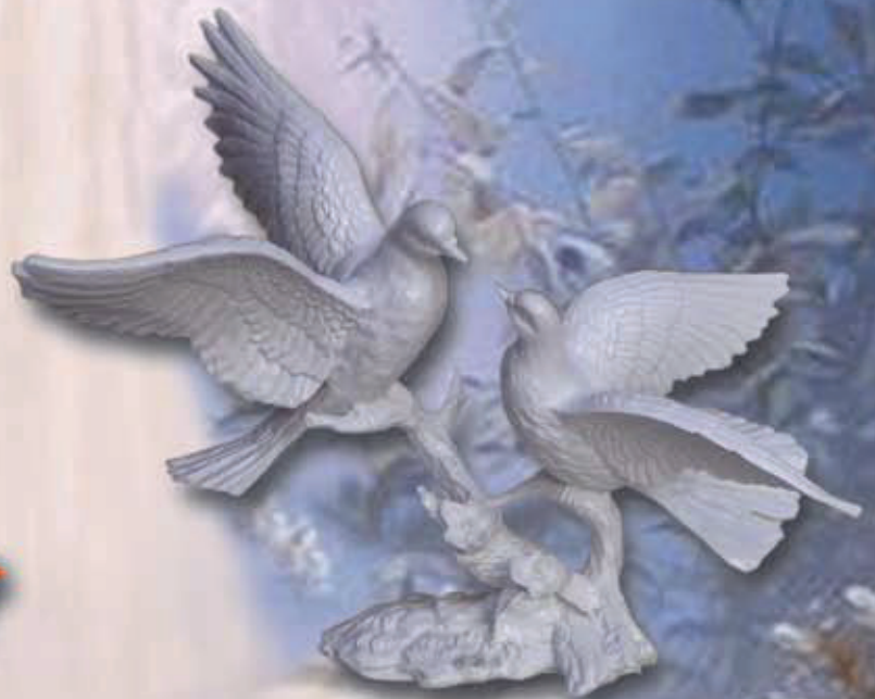
ART 4003 - cm 25x20x15