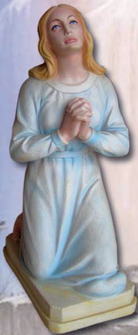
ART. 1264 - H cm 78