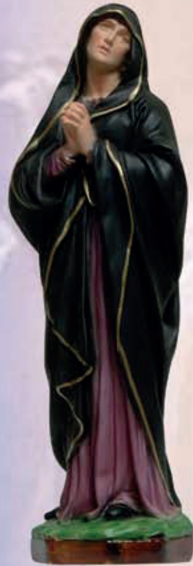
ART. 1231 - H cm 42