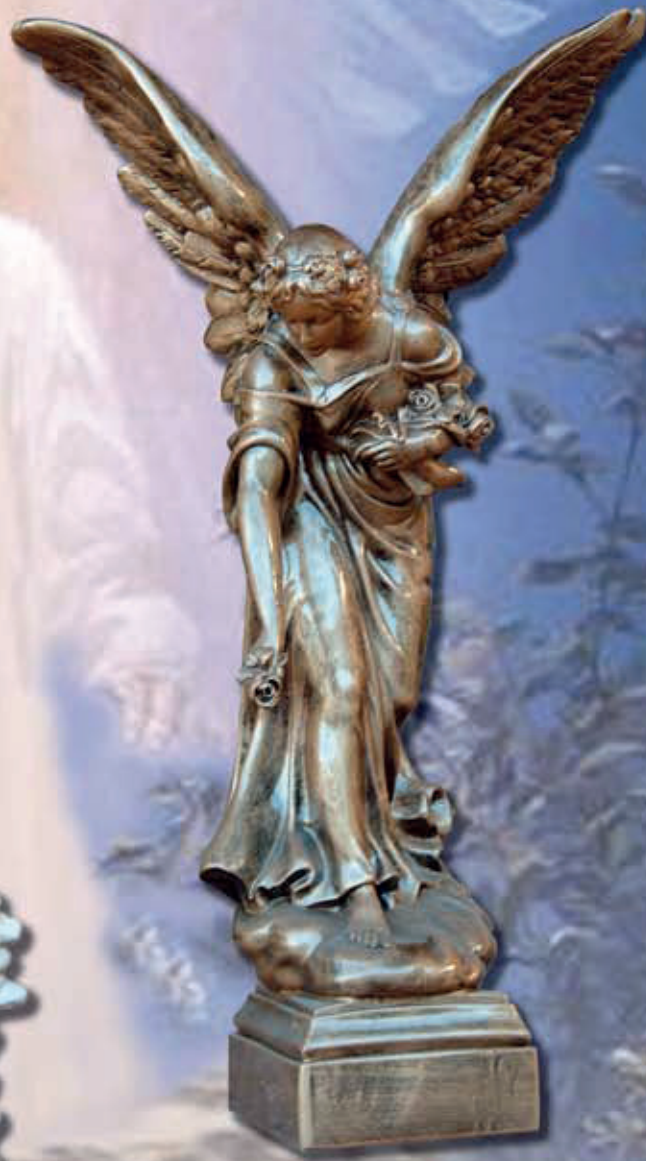
ART. 1203 - H cm 80

ART 1203 STATUA ANGELO GETTAFIORI ART 1204 STATUA ANGELO DEL SILENZIO