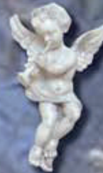
art 510 Dx cm 12x10x4