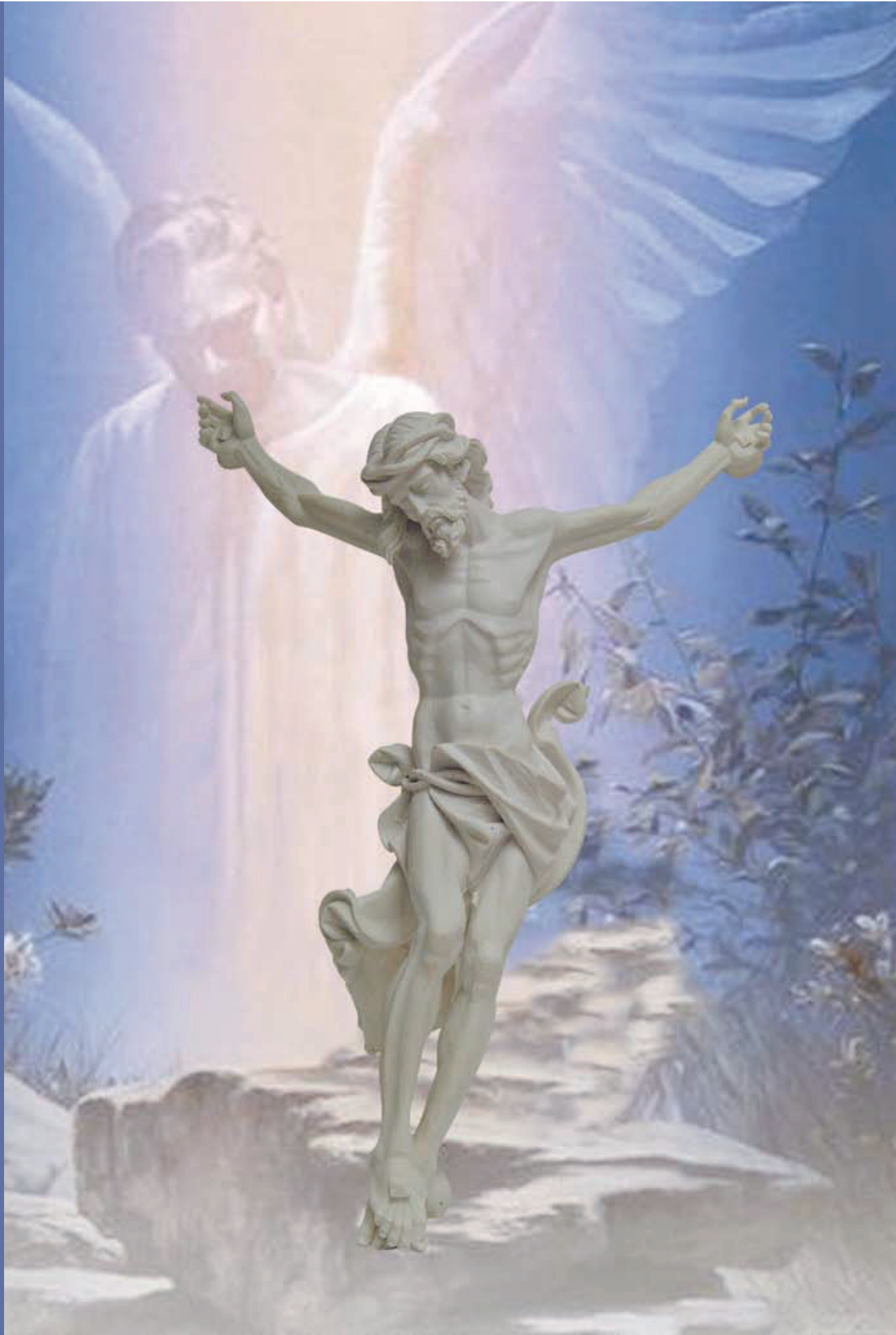
ART. 3200 CRISTO CROCIFISSO cm 30/50/60