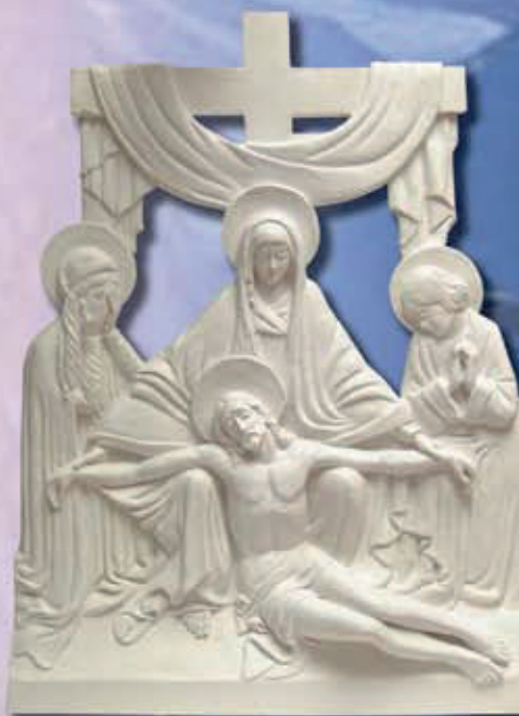
ART. 2236 - cm 93x68