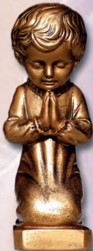
ART. 1259 - H cm 35