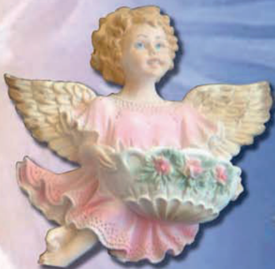
ART 2227 - cm 16