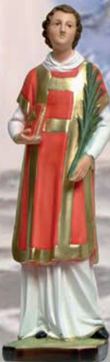
ART. 1249 - H cm 45