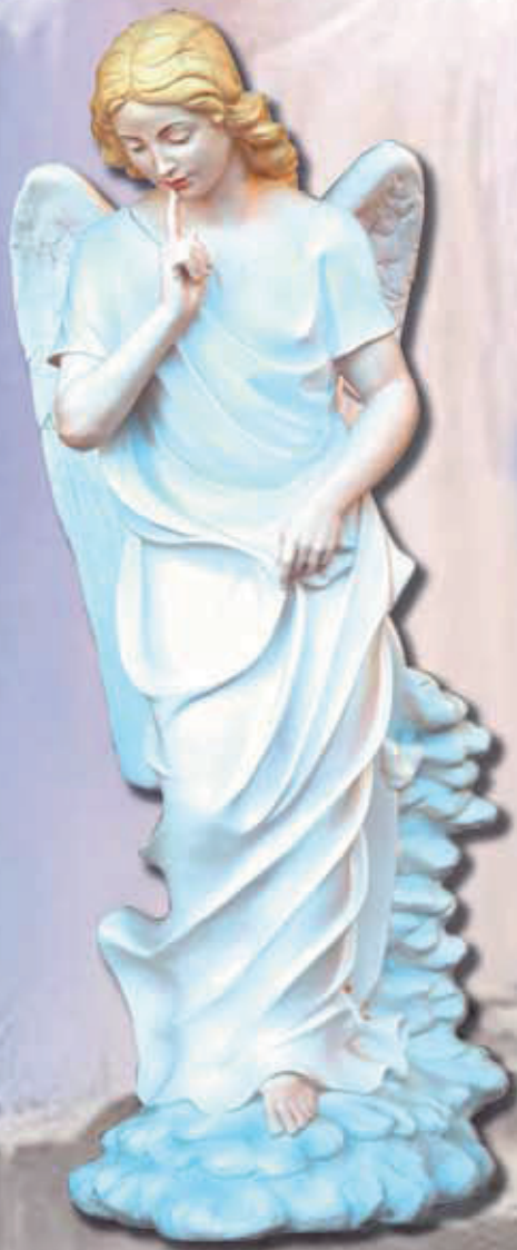
ART. 1204 - H cm 80