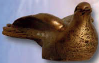
ART 4001 - cm 6x6x14