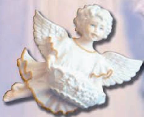
ART 2227 - cm 18