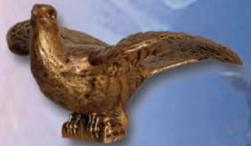
ART 4000 - cm 12x5x8