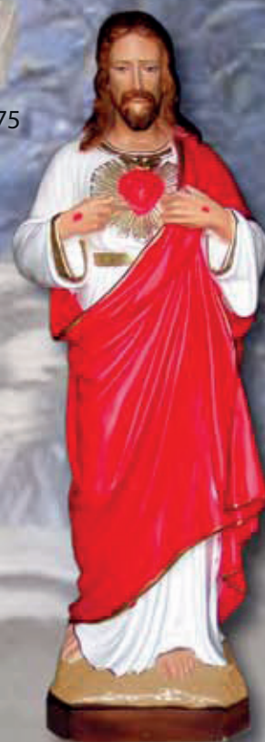
ART. 1301 H cm 20/30/40/60/80/120