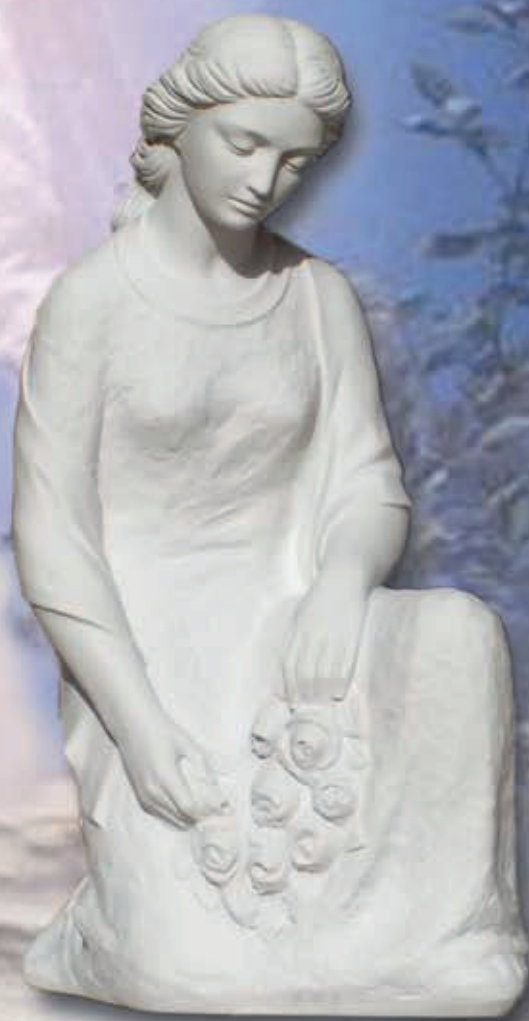
ART. 1265 - H cm 55

ART 1264 SANTA BERNADETTE ART 1265 DONNA GETTAFIORI