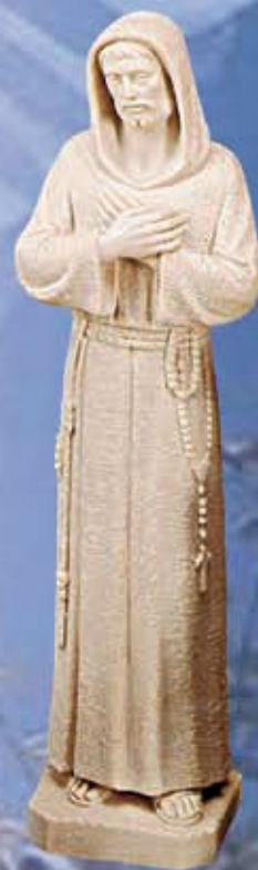
ART. 1295 - H cm 60