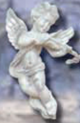
art 511 Sx cm 12x10x4