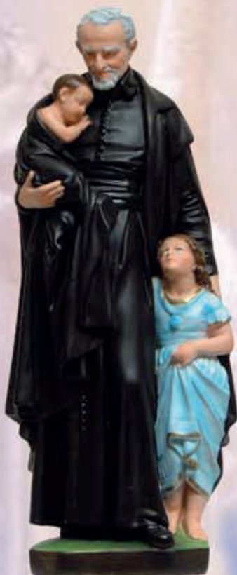
ART. 1244 - H cm 40