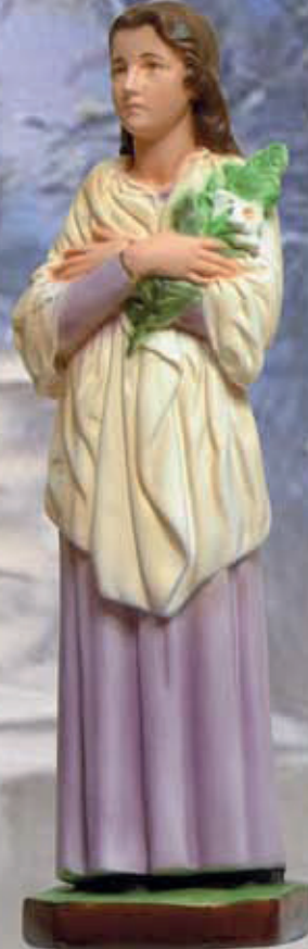
ART. 1239 - H cm 45

ART 1237 SANTA LUCIA ART 1244 SANT'ANNA ART 1232 SANTA CATERINA