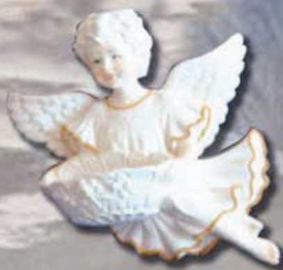
ART 2229 - cm 18