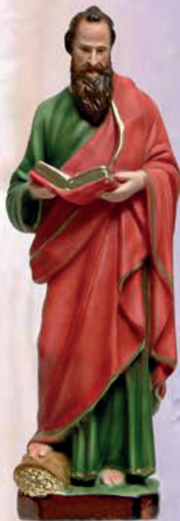
ART. 1246 - H cm 44