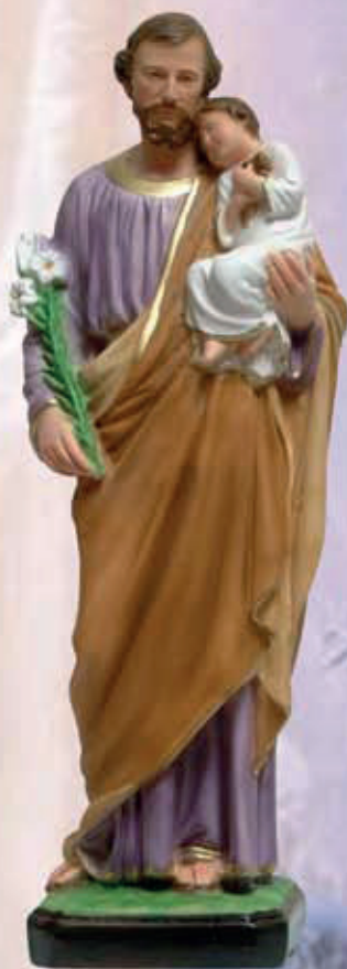
ART. 1245 - H cm 52