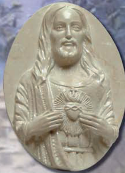
TARGA SACRO CUORE ART 2233