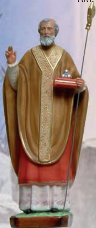
ART. 1248 - H cm 42