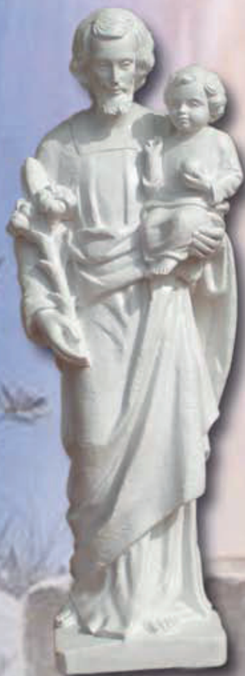
ART. 1300 - H cm 30/80