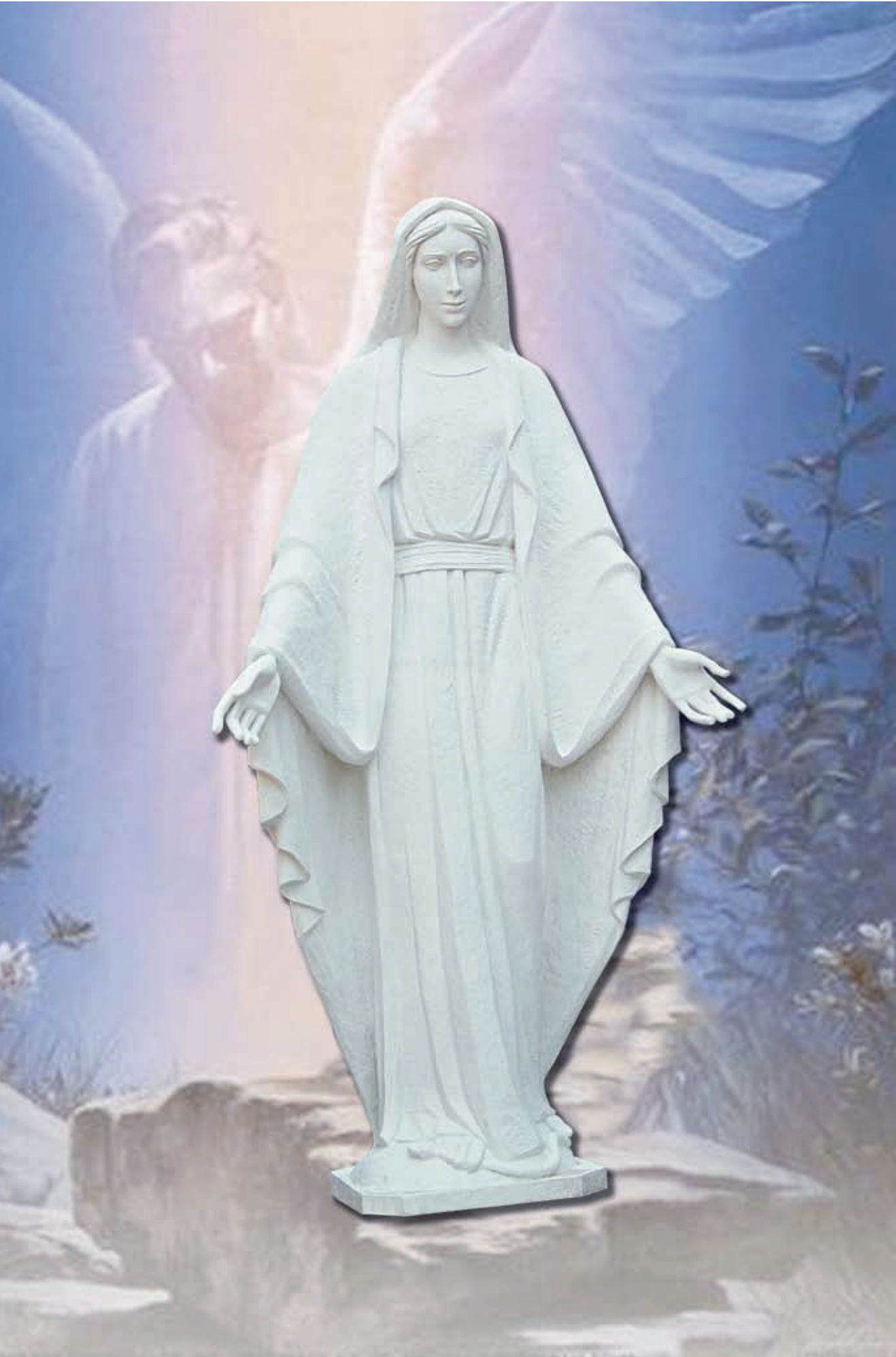
MADONNA h mt 5 (su richiesta)