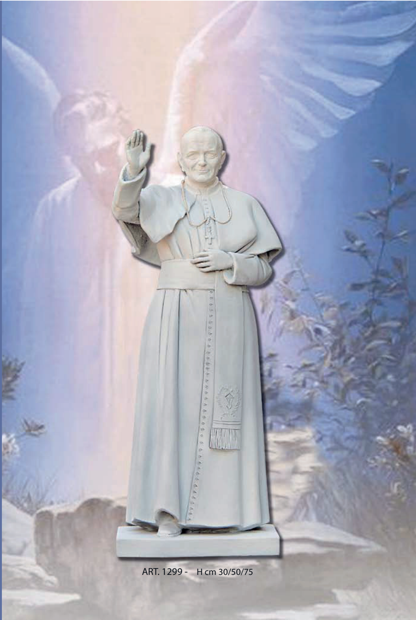
ART. 1299 - H cm 30/50/75