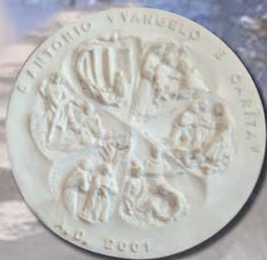
TARGA SANT'ANTONIO ART 1220 - Ø 28