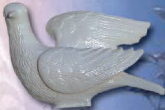
ART 4006 - cm 15x11x21