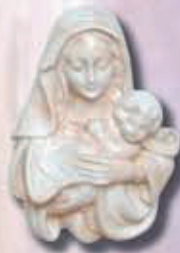
art 506 - cm 13