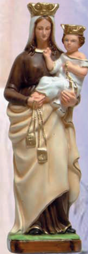
ART. 1242 - H cm 43