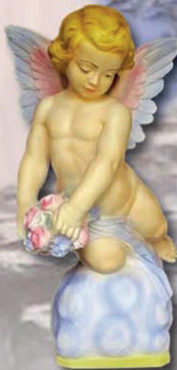
ART. 1254 - H cm 54