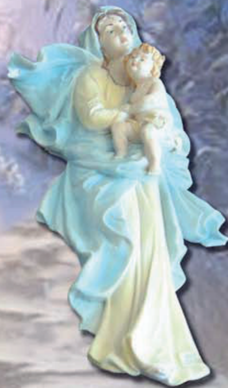
MADONNA CON BAMBINO ART 1212 cm 33