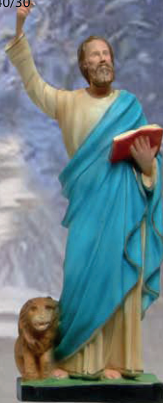
ART. 1251 - H cm 45

ART 1244 SAN VINCENZO DE PAOLI ART 1243 SAN SEBASTIANO ART 1248 SAN NICOLA