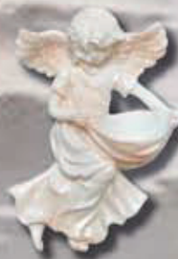
art 514 -cm 16